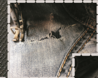
Passiert - repariert - als wenn nichts gewesen wäre.

So ist das auch mit deinem Lieblingsstück. Lange getragen, gut erhalten, aber nicht mehr modern. Das andere modisch, aber schon ein wenig abgetragen. Mit meiner Schneiderkunst schaffe ich aus dem Alten Neues und dein Lieblingsstück besteht fort.