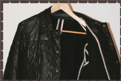
... zu deinem Maßdesign.