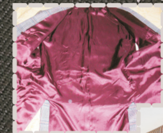
Feinste Futterstoffe und pfiffige Details geben deinem Lieblingsstück neuen Wert und aus alt wird neu.