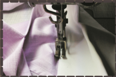
... in meiner modernen Werkstatt...